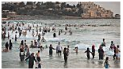
חוגגים את עיד אל פיטר בגן צרלס קלור (TimeOut)