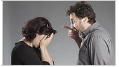
אילוסטרציה shutterstock: צילום