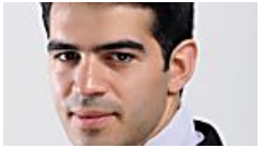
אין לו סודות, וגם לא שיטות מיוחדות, אז איך הוא מנצח את המדד בכל פעם? (TheMarker LABELS)